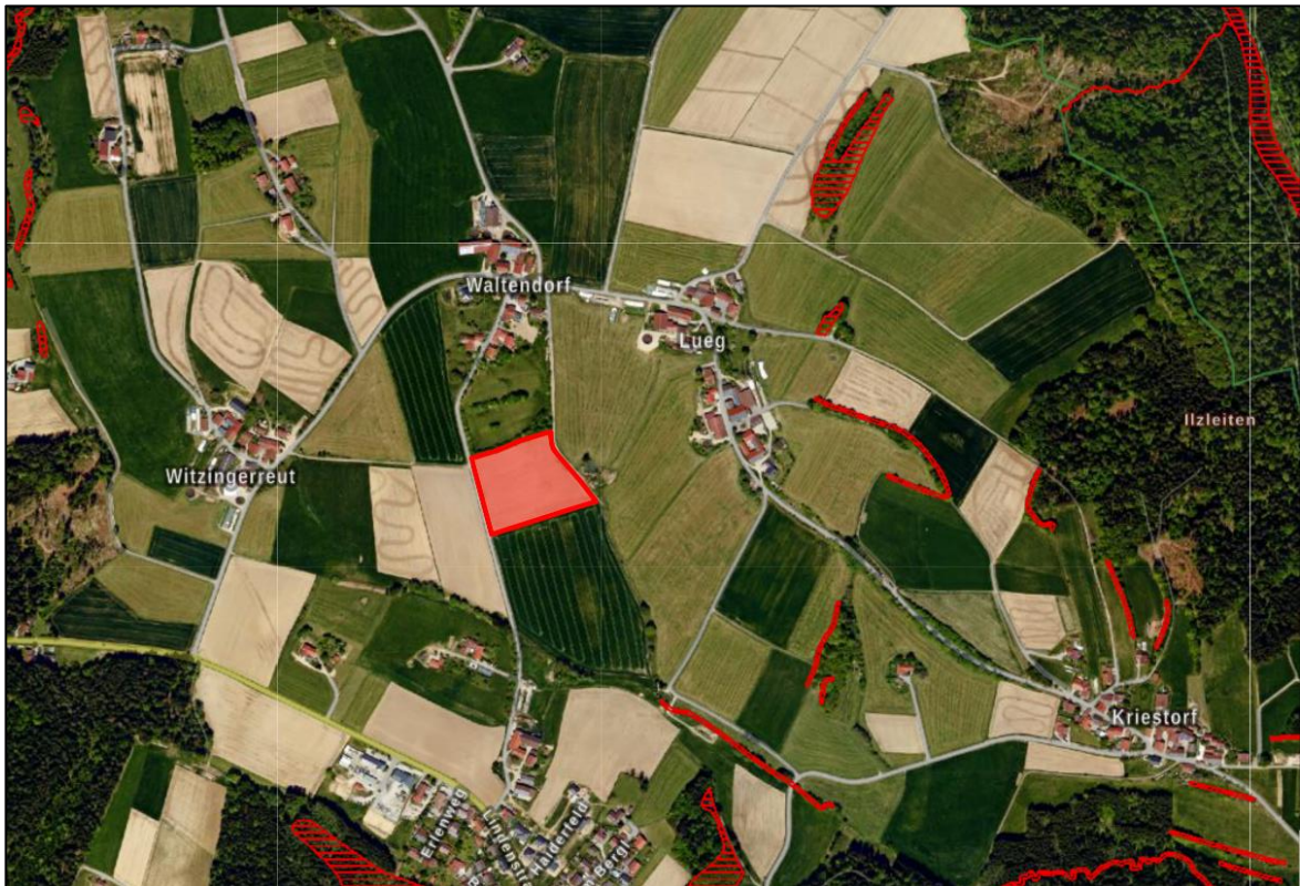
Abb. 3 Grober Umgriff des Geltungsbereichs im Luftbild (rot) und amtlicher Biotopkartierung. Ohne Maßstab.

Abb. 3 zeigt den Umgriff des Deckblatts im Luftbild.